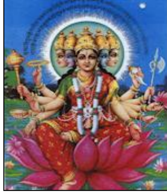
Krişna olarak gelmiş Tanrı Vişnu