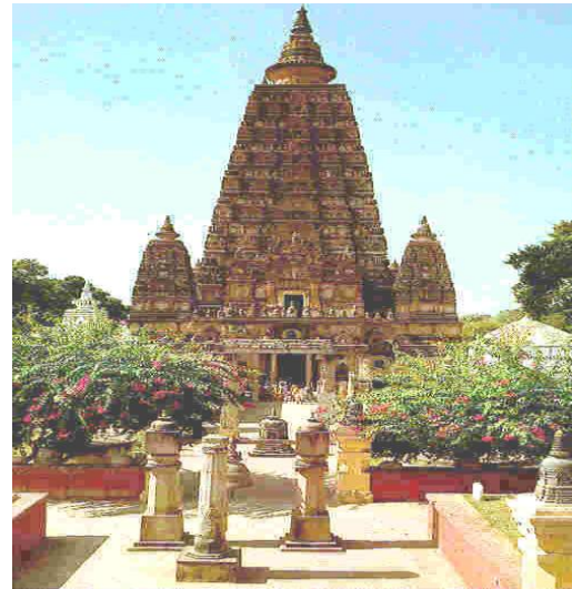
Buda'nın aydınlanmış olduğu yerde bulunan Budist mabeti

Mensupları: Yeryüzünde yaklaşık olarak 300-400 milyon civarında Budist yaşamaktadır. Bu din Güney ve Doğu Asya ülkelerinde yaygındır. Bazı batı ülkelerinde özellikle Zen Budizmi ilgi görmüş ve yeni taraftarlar kazanmıştır.