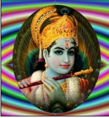
Koruyucu ve destekleyici Tanrı Vişnu'nun insan şekline dönüşmüş hâli: Krişna