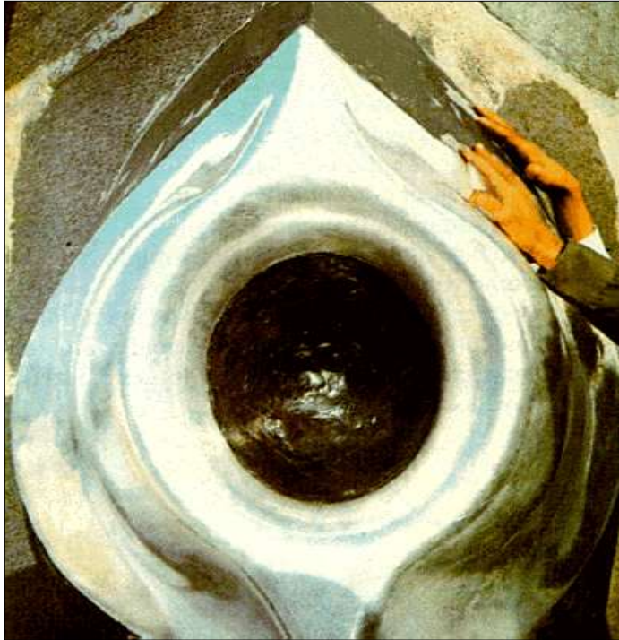
Haceriesved (Siyah taş)

Kutsal taş "Haceriesved (Siyah taş)" Kâbe duvarında yer almaktadır.